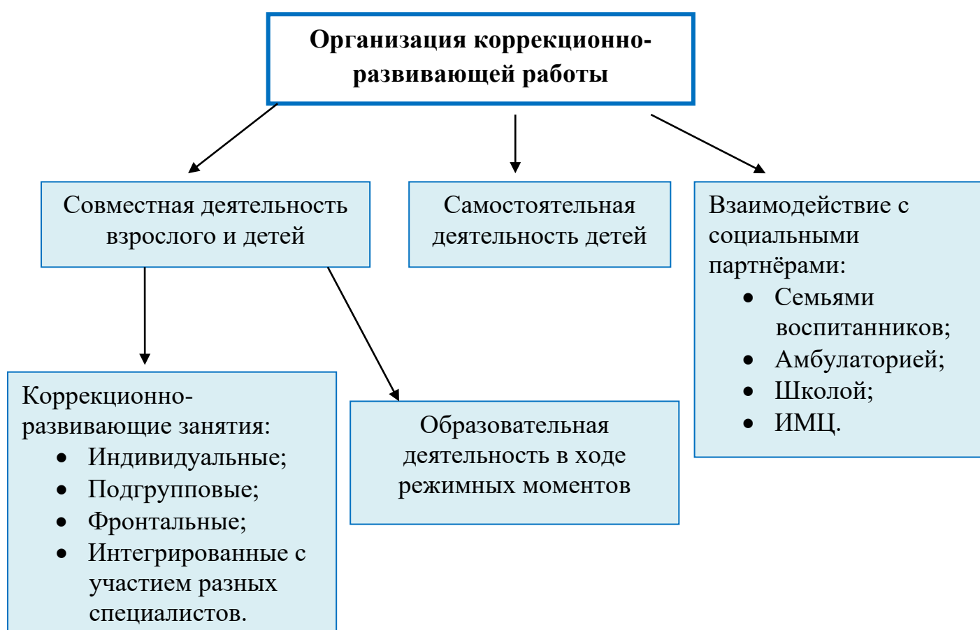
Рис.1. Модель организации коррекционно-развивающей работы.

В соответствии с профилем группы, образовательная область «Речевое развитие» выдвинута на первый план, так как овладение родным языком является одним из основных элементов формирования личности. Такие образовательные области, как «Познавательное развитие» , «Социально-коммуникативное развитие» , «Художественно-эстетическое развитие» ,