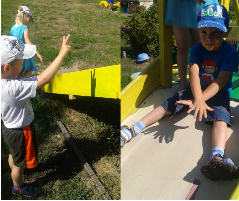
Играем в игру «Чья тень?»