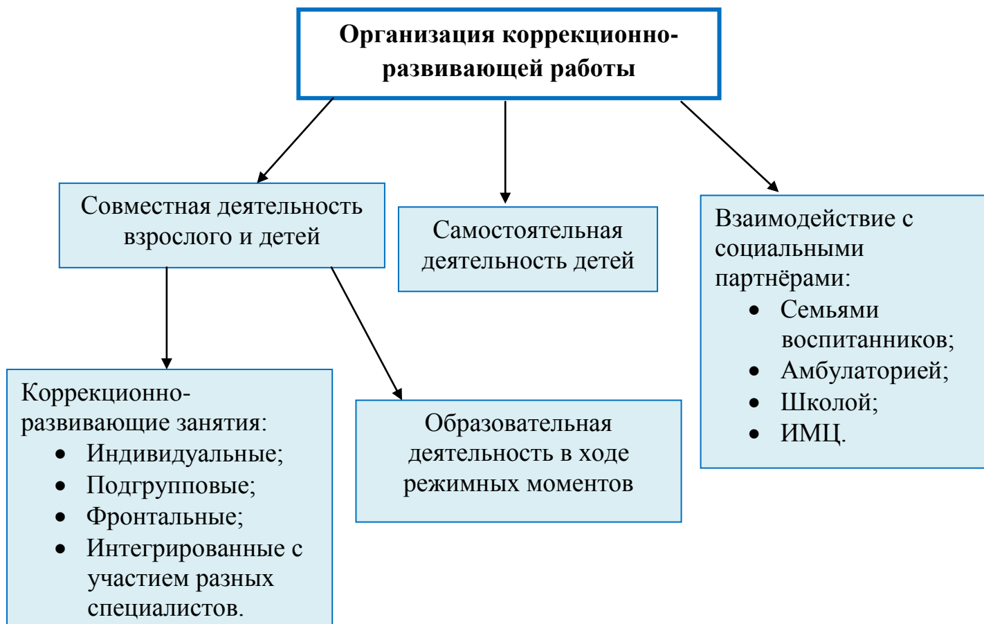
Рис.1. Модель организации коррекционно-развивающей работы.

В соответствии с профилем группы, образовательная область «Речевое развитие» выдвинута на первый план, так как овладение родным языком является одним из основных элементов формирования личности. Такие образовательные области, как «Познавательное развитие» , «Социально-коммуникативное развитие» , «Художественно-эстетическое развитие» , «Физическое развитие» , связаны с основным направлением и позволяют решать задачи умственного, творческого, эстетического, физического и нравственного развития и, следовательно, решают задачу всестороннего гармоничного развития личности каждого ребёнка.